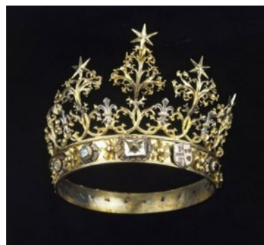
Kroon uit de kerkschat van de Grote Kerk, in langdurig bruikleen van Parochie Maria Sterre der Zee.

Als we uitgaan van het waarden stellend kader voor museale objecten dat is ontwikkeld in het kader van het Deltaplan voor Cultuurbehoud, bezit het Haags Historisch Museum enkele stukken uit de A-categorie (de top van het Nederlands cultuurbezit). Het gaat dan bijvoorbeeld om de eerder genoemde kerkschat uit de Grote Kerk (langdurig bruikleen van de parochie Maria Sterre der Zee met de status van wettelijk beschermd erfgoed onder de Erfgoedwet), de tong en vinger van de gebroeders De Witt en het familieportret Van den Kerckhoven door Jan Mijtens. De stukken uit de A-categorie vormen samen met collectieonderdelen uit de B-categorie (met een hoge attractie- of presentatiewaarde) de kerncollectie. Het overgrote deel van de collectie behoort tot de C-categorie (geen grote culturele