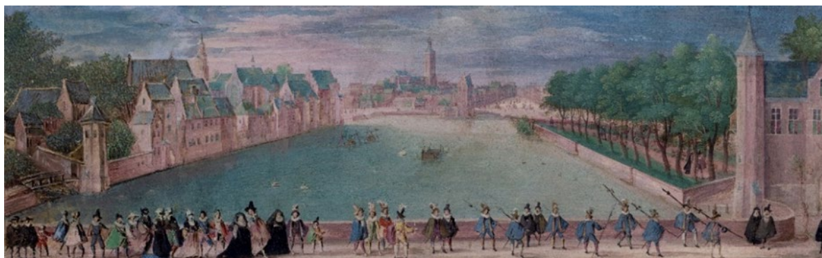
Gezicht op de Hofvijver, Hollandse school, 1590-1600, inkt, potlood en gouache op perkament, 9 x 26 cm.